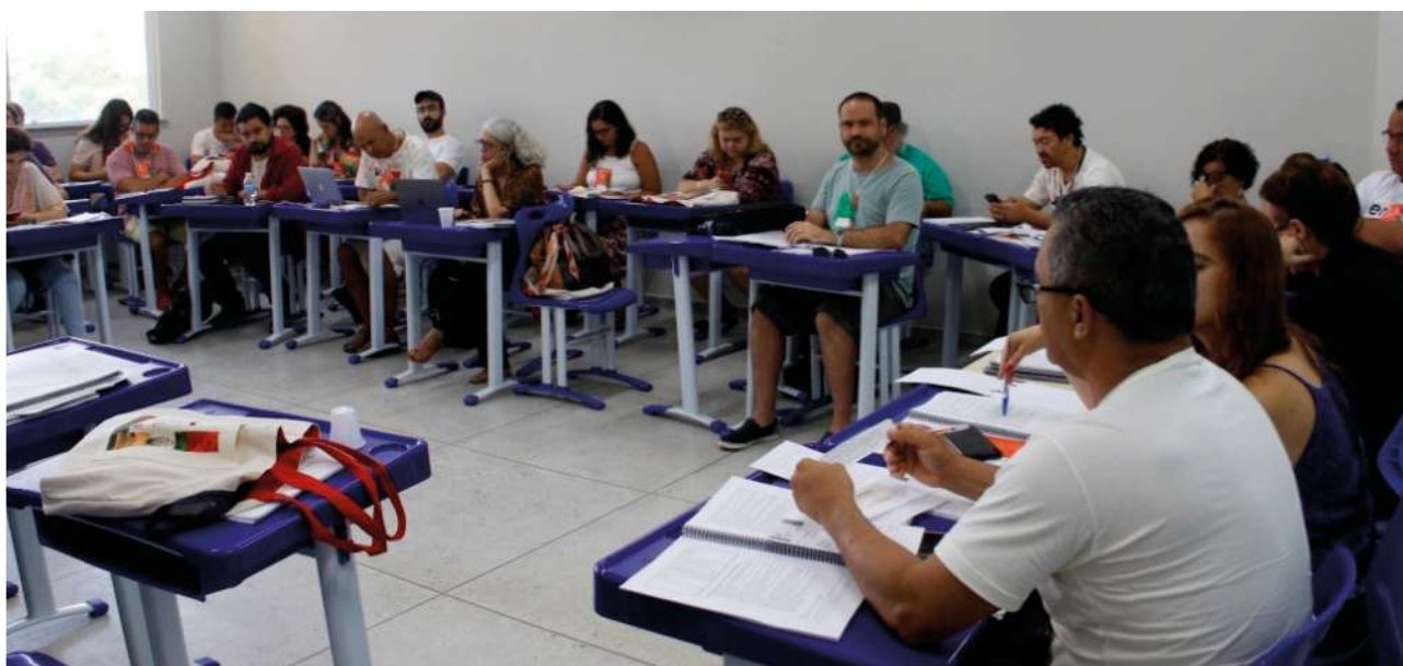
Reunião para debater propostas de TRs no 38º Congresso do ANDES, realizado em janeiro de 2026