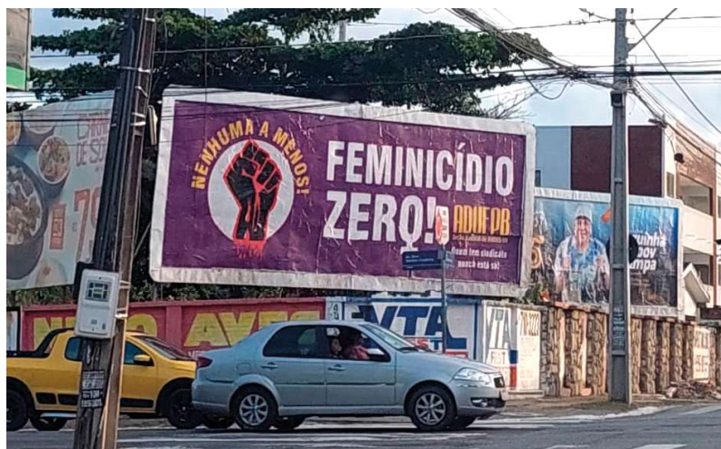
Outdoors das campanhas “Sou Docente Antirracista” e “Nenhuma a Menos”, promovidas pela ADUFPB na Capital e no interior